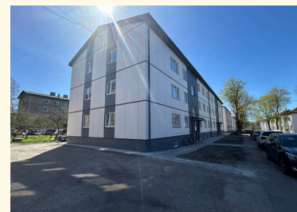
3-kordne korterelamu Kuressaares