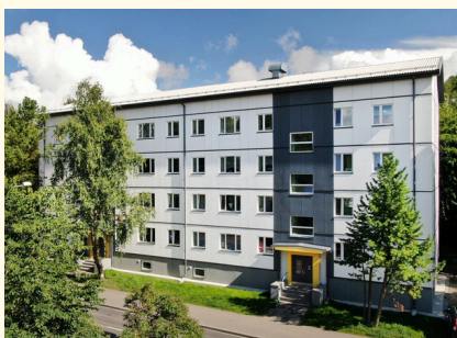
4-kordne korterelamu Tallinnas