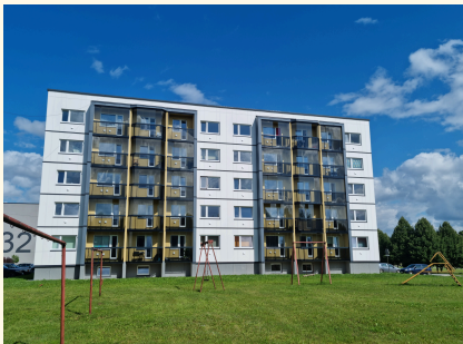
30 korteriga korterelamu Märjamaal

Järgnevatel lehekülgedel on erinevaid näiteid tehaselise renoveerimise projektidest nii KredExi pilootprogrammis kui ka Eesti puitmajatootjate rahvusvahelistest projektidest. Need näited ilmestavad innovatiivseid lahendusi, parenenud hoonete energiatõhusust ja praktilisi tulemusi, mis on saavutatud koostöös korteriühistute, töövõtjate ja riigi toetuse abil.