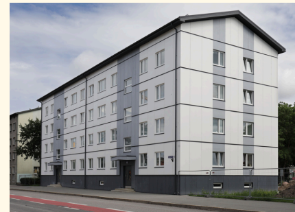
4-kordne korterelamu Tallinnas