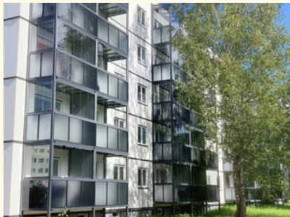
60 korteriga korterelamu Sindis