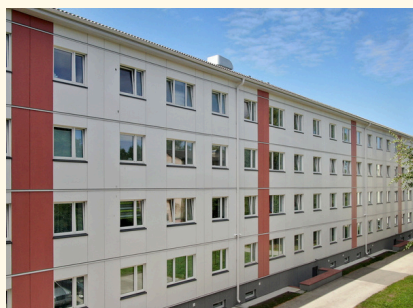
4-kordne korterelamu Tallinnas